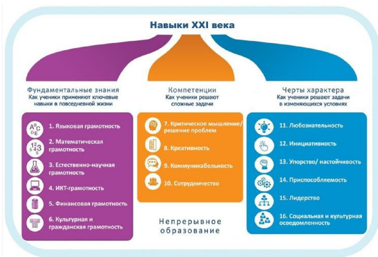
Рисунок 1. Образовательная модель World Economic Forum

С целью решения этой проблемы проектной группой Всемирного экономического форума была разработана и представлена в докладе «Новый взгляд на образование» модель, включающая в себя три типа образовательного результата: знания предметных областей с акцентом на функциональные грамотности, включая ИКТ-грамотность, компетенции 4К и качества характера.