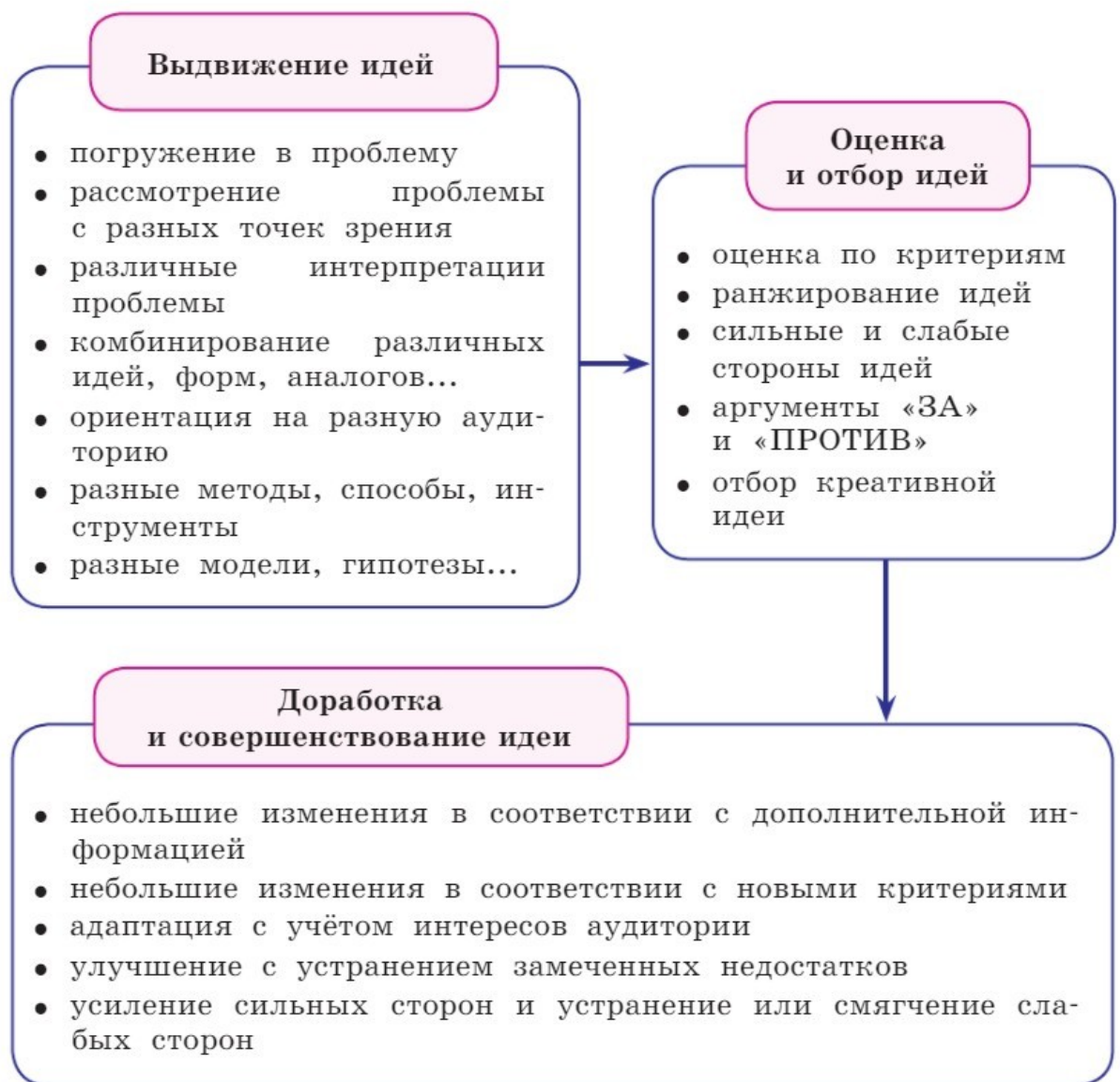
Рисунок 2. Действия, требуемые при выполнении заданий на креативность

При оценивании заданий учитывается, что креативная идея (решение) – это всегда идея: